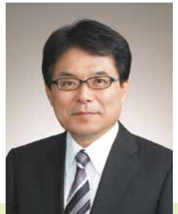
増田 寛也氏(日本創成会議座長)