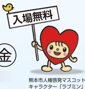
熊本市人権啓発マスコットキャラクター「ラブミン」