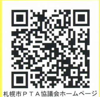
札幌市PTA協議会ホームページ