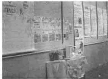
パネル展示のほか、ミモザのイラストをバックに写真を撮るコーナーも設置

しかった」などのほか「はあもにいを初めて知った。図書館もあるし素敵な施設」といった、会館に関するメッセージもありました。