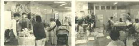
昨年の「はあもにいフェスタ 2021」の様子。参加団体が、それぞれの活動を披露。1階ではパザールやパネル展示などを、2階以上ではワークショップやセミナーなどを行いました。

申込 応募要綱を必ず読んだ上で、5月31日(火)までに応募用紙に必要事項を記入し、当館へ持参または郵便、メールで提出。応募用紙は、はあもにい館内またはホームページで入手できます