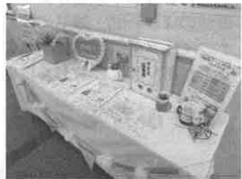
抽選でミモザの花束などが当たる男女共同参画クイズ。オンラインでも応募でき好評でした