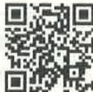
▲電子図書館 QRコード

①市立図書館ホームページのリンクから、またはQRコードを読み取って電子図書館のサイトにアクセスします。